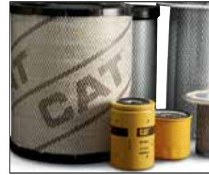
Refacciones genuinas OEM