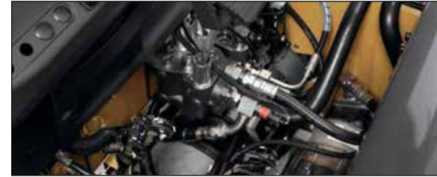
Garantía de fábrica para protección adicional