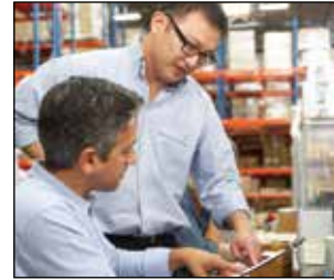
Paquetes de financiamiento habituales