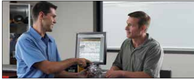
Servicio y soporte local