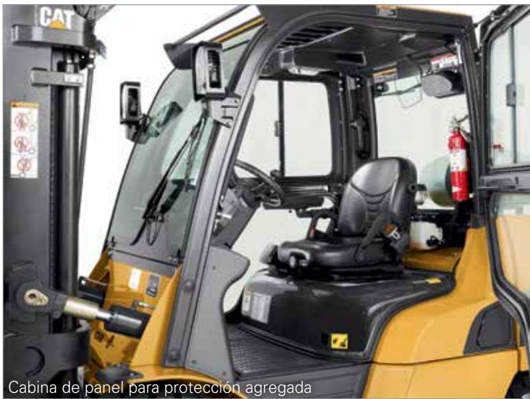
Cabina de panel para protección agregada