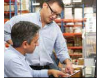
Paquetes de financiamiento a la medida