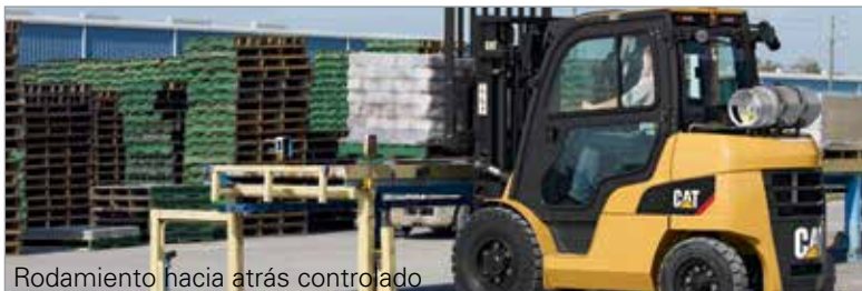
Rodamiento hacia atrás controlado

*Pregunte a su distribuidor local por una lista completa de opciones.