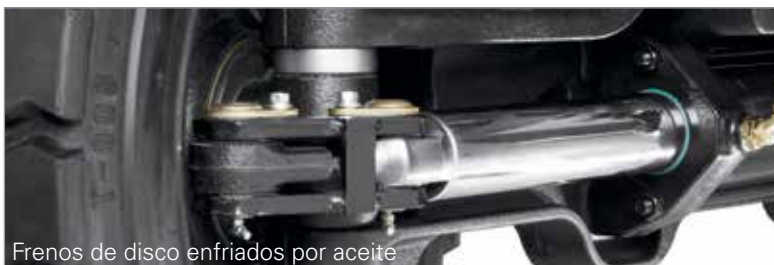
Frenos de disco enfriados por aceite

Mejorar la productividad y reducir el riesgo de desgaste prematuro del componente con freno de disco húmedos opcionales, que incluyan sistemas tales como ProShift™ y rodamiento hacia atrás controlado para retardar y controlar el montacargas