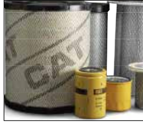
Repuestos genuinos de OEM