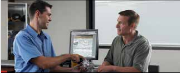
Servicio y soporte local